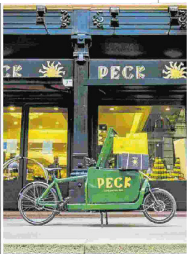
▲ Delivery Peck consegna a domicilio colombe classiche e uova decorate